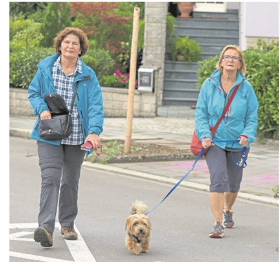
Rund 250 Wanderer nahmen teil

Zur zweiten Auflage dieser IVV-Gedenkwanderung nahmen rund 250 Wanderer aller Altersstufen teil. Mit dieser Veranstaltung drückten die Teilnehmer und Veranstalter ihr Gedenken an die Aktivistin aus. Zudem