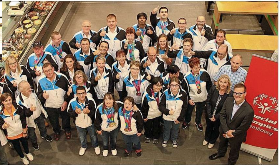
Die außergewöhnliche Bilanz des Luxemburger Teams, das 28 Medaillen errang, wurde gewürdigt.

Herzlicher Empfang für Special-Olympics-LA-Team